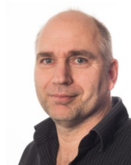
Klaas Wierenga – inventor of eduroam – included in the Internet Hall of Fame

from https://wigo.net/stats#ssidstats november 2019